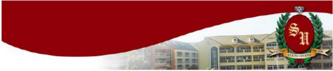
อบรมครูโรงเรียนสาธิตเตรียมอุดมฯ โนนหลักสูดตล "วิถีสร้างการเรียนรู้ในศตวรรษที่ 21"