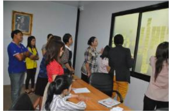
อบรมเชิงปฏิบัติการ การจัดการเรียนรู้สู่ศตวรรษที่ 21 ณ โรงเรียนพลุดาหลวงวิทยา (อบจ.ชบ.6)